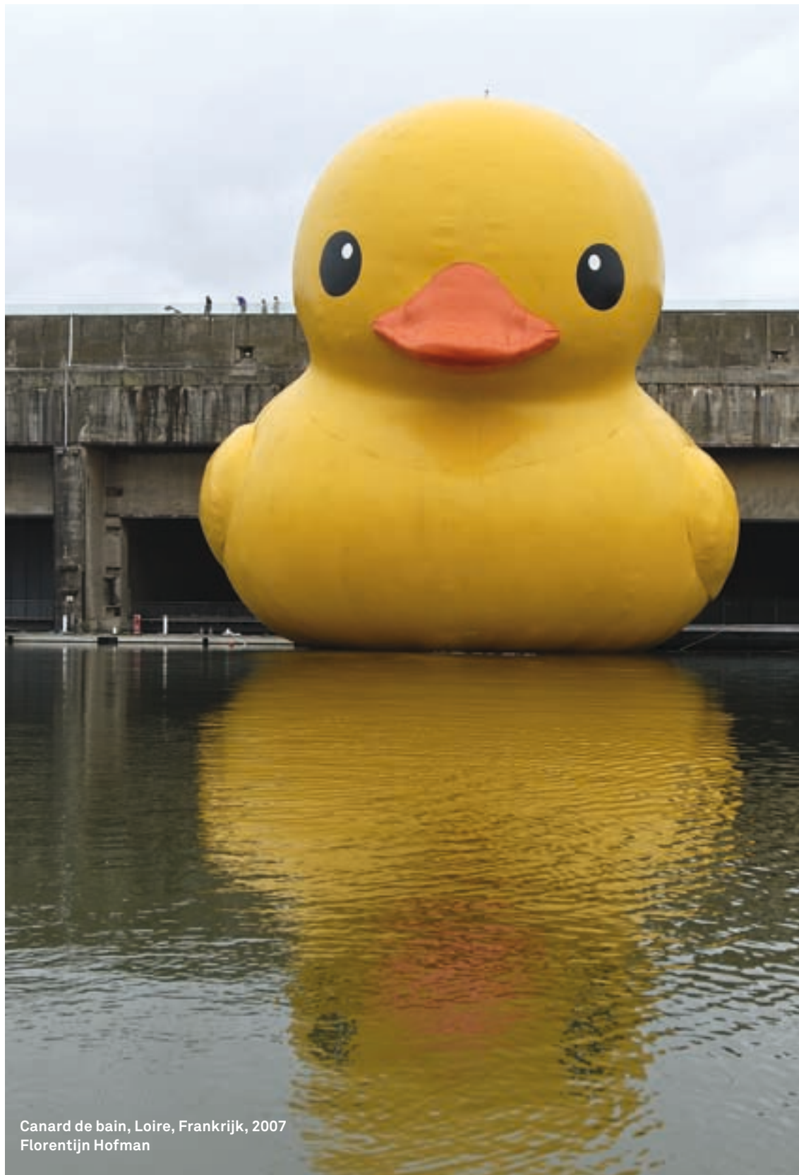
Canard de bain, Loire, Frankrijk, 2007 Florentijn Hofman