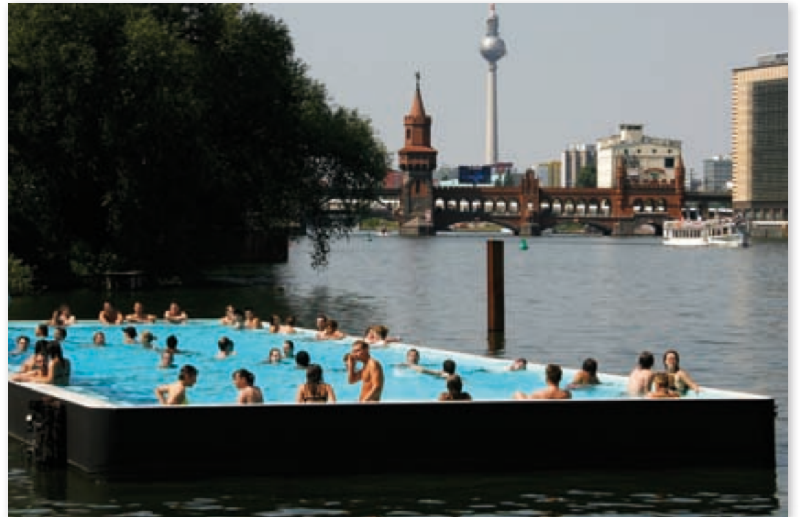
Inspiratiebeelden uit het boek 'Water Republic'